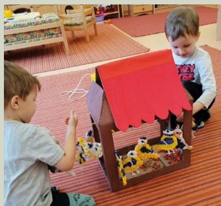
Téli madáretetés a Gomba csoportban