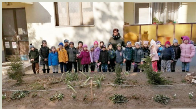
Séta alkalmával hóvirág megfigyelés