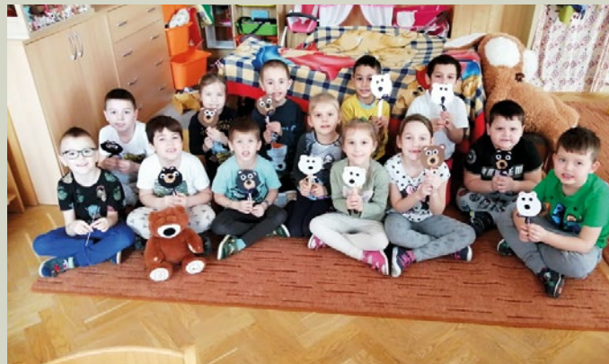
Maci hét a Katica csoportban