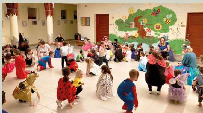
Farsangi Táncház az óvoda aulájában