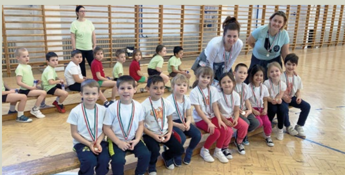
Oviolimpia III. helyezette a Pillangó és a Cica csoport közös csapata