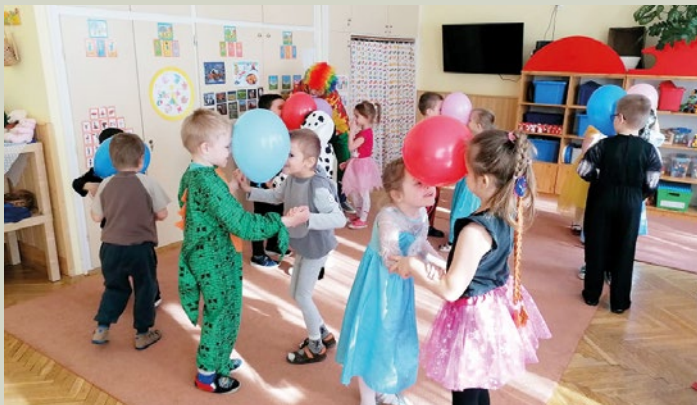
Farsangi hangulat a Napocska csoportban