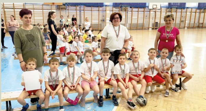
Oviolimpia II. helyezette a Nyuszi és a Micimackó csoport közös csapata