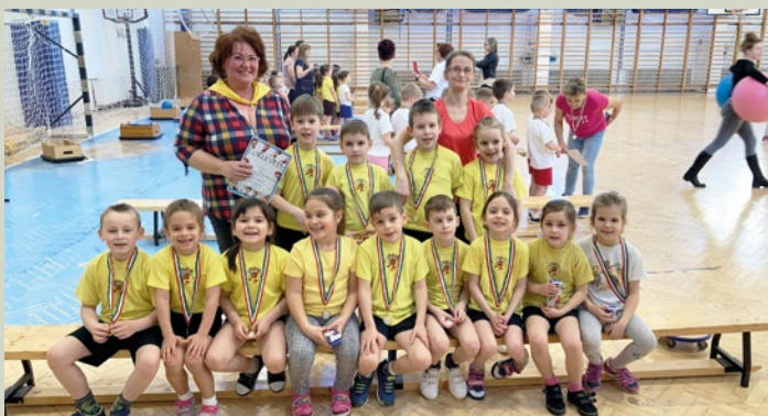
Oviolimpia I. helyezette a Méhecske csoport